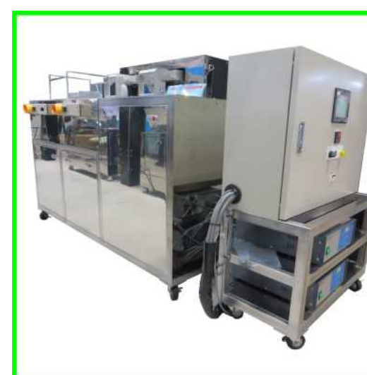
2槽式リサイクル超音波洗浄機

搬入のために前後を分離することが可能となっております。装置仕様：昇温、循環、揺動、引上げ、超音波1200W、タイマー付、搬入のための分離が可能 オーダーに応じて設計・製作いたします。その他、温調や循環もご相談に応じて設計できます。