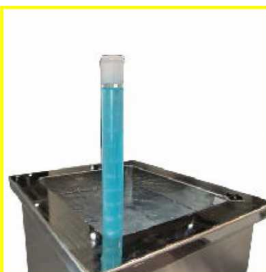
超音波発振チェッカー

オーダーメイドという特徴を生かし、ドーナツ型の振動子を実現しました。円筒形の槽で隅々まで均一な洗浄を可能にしました。他社メーカー様ご購入予定の方、発注前に一度ご相談ください！