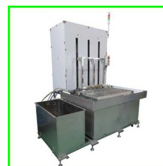
1槽式大型ワーク用超音波洗浄機

ガラス製の槽を使用し二重槽にすることにより、酸での超音波洗浄を可能にしています。装置仕様：揺動、自動引上げ、超音波1500W オーダーに応じて設計・製作いたします。その他、温調や循環もご相談に応じて設計できます。