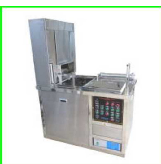
1槽式自動超音波洗浄機

感染症対策の一環として、除菌スプレーを足踏み式で使用できる装置を開発致しました。さらに室温や物体の温度計測も同時に行うことができます。