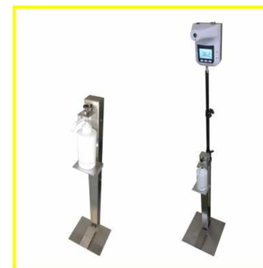
足踏み除菌スプレースタンド

超音波洗浄機のリサイクルとして自動洗浄機の中古パーツ(槽・超音波装置・ポンプ等)を再利用し、1槽式のユニット洗浄機を製作いたします。また、中古パーツの販売も行っております。