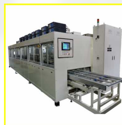
自動超音波洗浄機

オーダーに応じて設計・製作いたします。その他、温調や循環もご相談に応じて設計できます。他社メーカー様ご購入予定の方、発注前に一度ご相談ください！