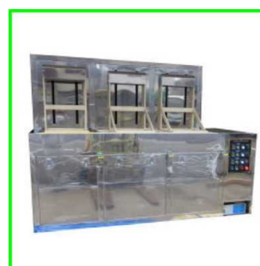
PVC+ガラス槽3槽式洗浄機

1槽式のユニット型洗浄装置です。装置仕様：揺動、引上げ、冷却、昇温、循環、超音波300W オーダーに応じて設計・製作いたします。その他、温調や循環もご相談に応じて設計できます。