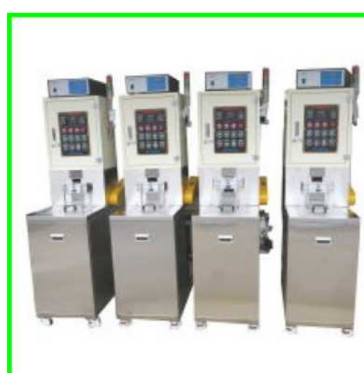
1槽式単独超音波洗浄機

安全装置として自動シャッター、エアセンサーが取り付けられています。装置仕様：揺動、引上げ、循環、自動シャッター、安全エアセンサー、超音波1500W オーダーに応じて設計・製作いたします。その他、温調や循環もご相談に応じて設計できます。