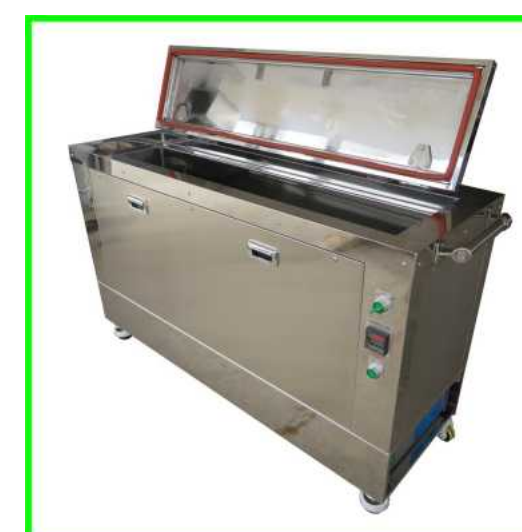
1槽式長尺ワーク用超音波洗浄機

リサイクル洗浄機の一例です。槽とヒーター、ポンプは中古品を使用しております。装置仕様：超音波1200W×2、揺動、引上げ、温調、循環、洗浄槽・ヒーター、ポンプを再利用 オーダーに応じて設計・製作いたします。その他、温調や循環もご相談に応じて設計できます。