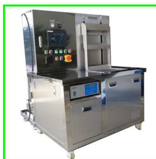
1槽式超音波洗浄機

治具を洗浄する装置です。装置仕様：揺動付、超音波2400W オーダーに応じて設計・製作いたします。その他、温調や循環もご相談に応じて設計できます。