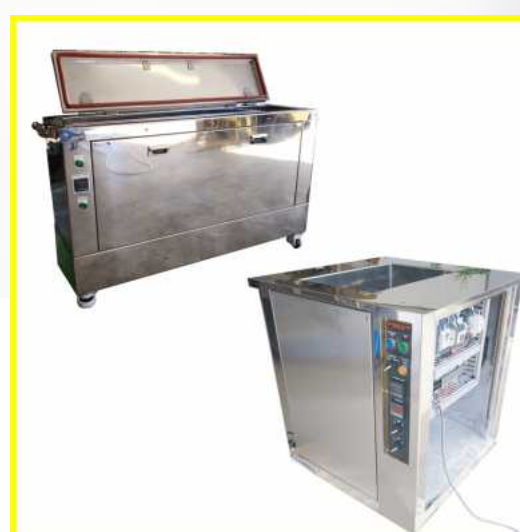
手動超音波洗浄機

発振器はデジタル表示で現在の出力を管理でき、周波数も数字で確認することができます。自動チューニング機能が振動子の最適条件を検知し、安定的な超音波発振を維持します。振動子はサイズやステンレスフレキ、電線の長さを任意で決めることができます。取付金具や取っ手もオプションで用意しています。