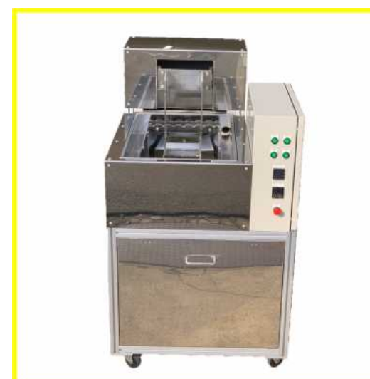
リサイクル洗浄機

自動洗浄機に使用されている超音波洗浄機が故障した場合、故障したもとの同じ寸法、仕様のもを設計製作、取替え、配線工事及びメンテナンスまでご提案します。他社メーカー様ご購入予定の方、発注前に一度ご相談ください！